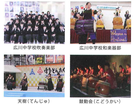
広川中学校吹奏楽部